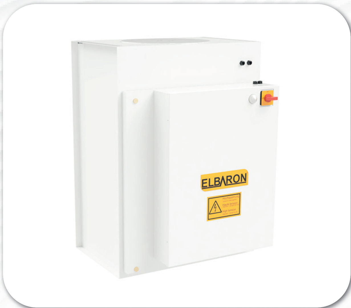
ELBARON® elektrostatischer Luftfilter Baureihe : Elbaron RON 100 D1TR | D2TR