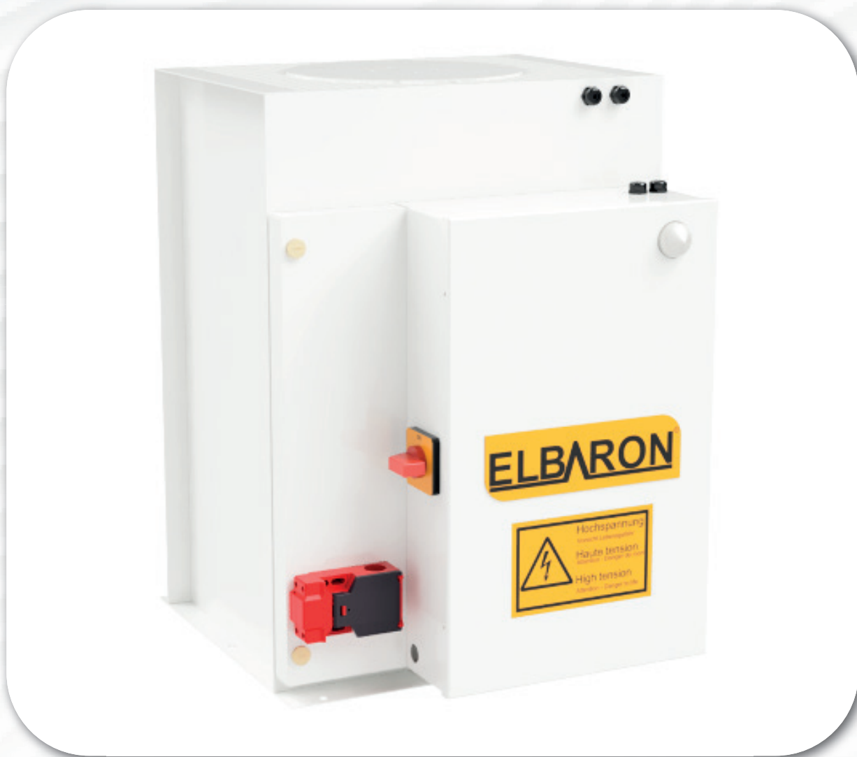
ELBARON® elektrostatischer Luftfilter Baureihe : Elbaron RON 60 STR