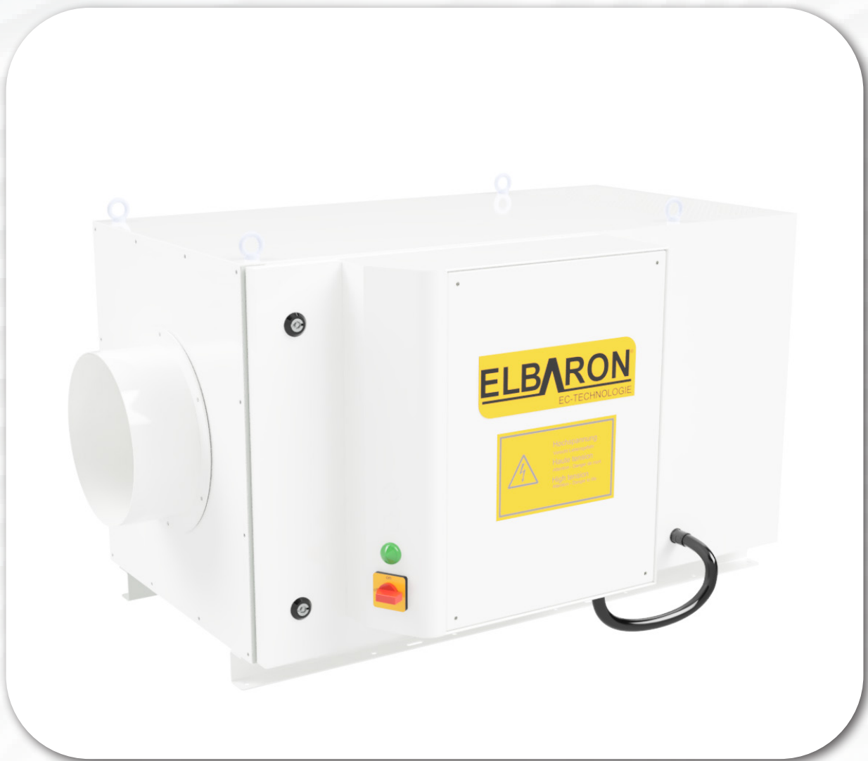
ELBARON® elektrostatischer Luftfilter Baureihe : Elbaron E-RON 4 D1TR | D2TR