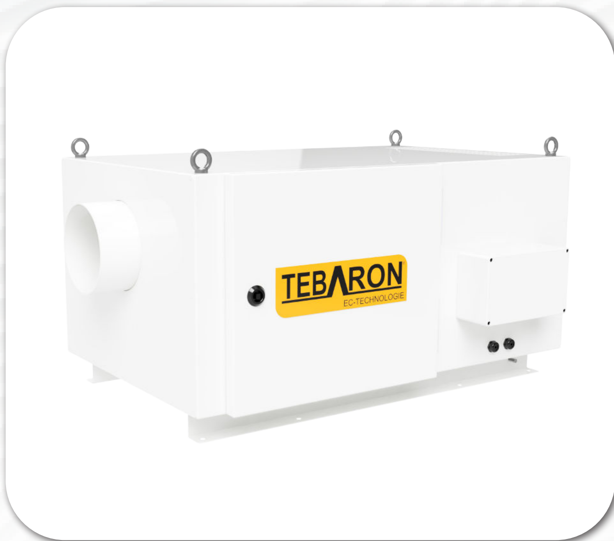
TEBARON mechanischer Luftfilter Baureihe : Tebaron TEB EH1-EC