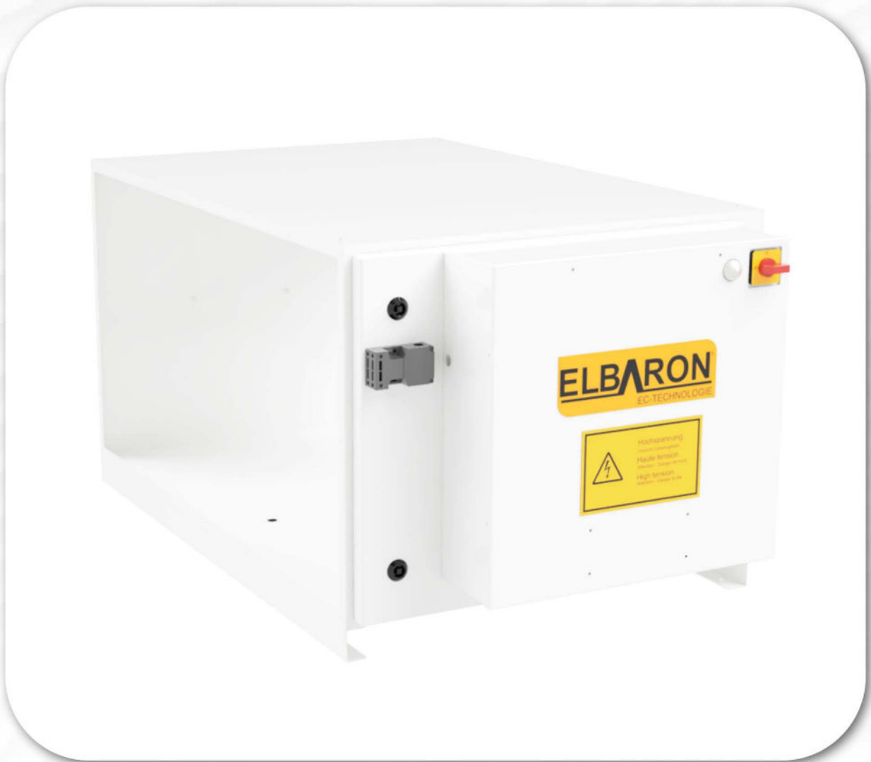
ELBARON® Kanalluftfiltergerät Baureihe : Elbaron RON 20 D1ogK | D2ogK